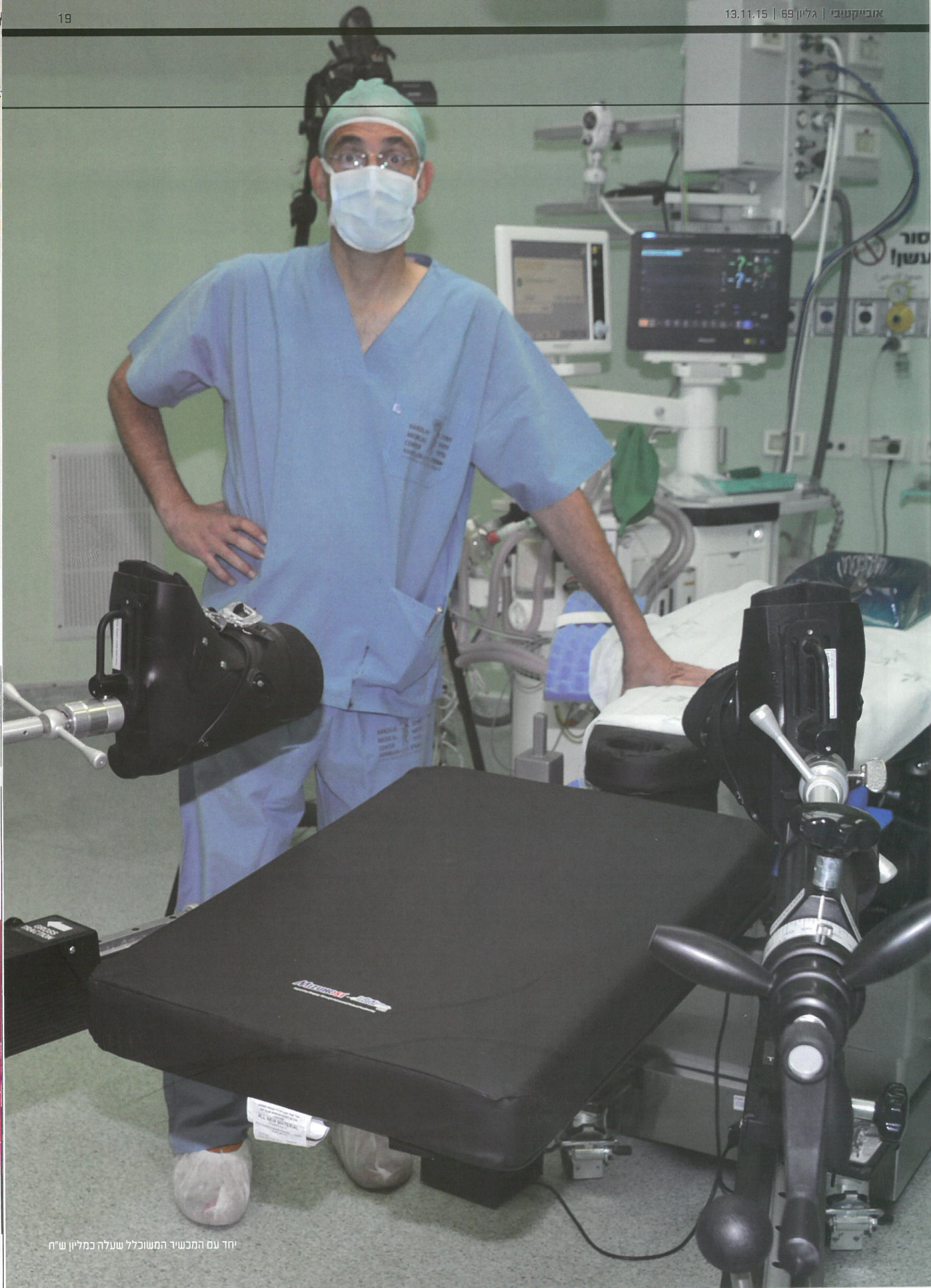
יחד עם המכשיר המשוכלל שעלה כמליון ש"ח