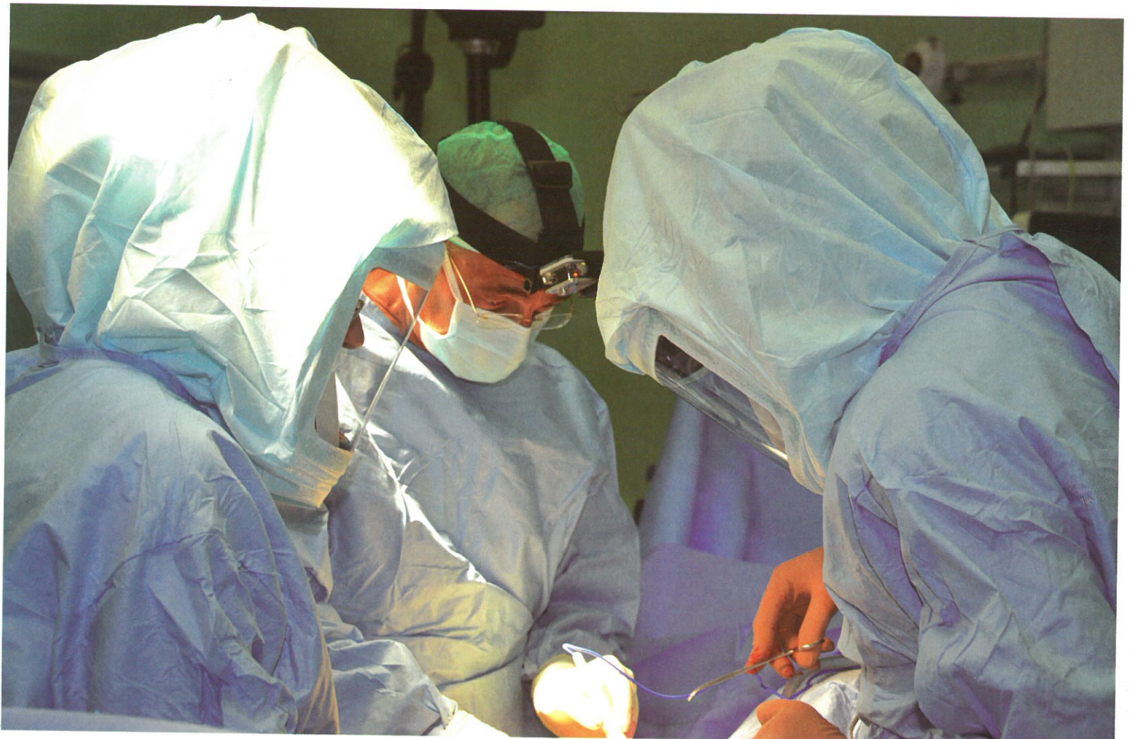
הצוות המנצח, שהפך את המחלקה למובילה בארץ

יש שאלה מסויימת שאתה שואל את המועמד בכדי להבין אם יש בו את התכונות שאתה מבקש?