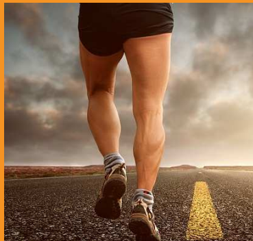
שחרור מהיר לאחר החלפת מפרק - יש לשים לב

הקפידו על פיזיותרפיה יומיומית, אפוסטרפיה ותזונה שיקומית