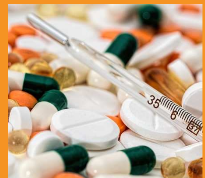
רפואת כאב - נטילת הטיפול בהתאם להנחיות

הקפידו על נטילת הטיפול התרופתי להפחתת כאב והמשך תרגול