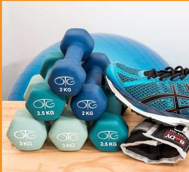
פיזיותרפיה ביתית ואפוסטרפיה