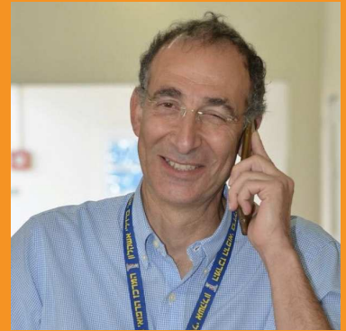
מעקב ודיווח לצוות המרפאה

הקפידו על פיזיותרפיה יומיומית, אפוסטרפיה ותזונה שיקומית